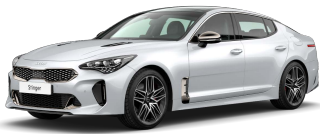
Perleťová Bílá Snow (SWP)