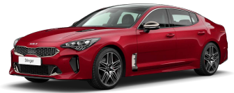
Červená Hi Chroma (H4R)