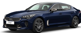
Modrá Deep Chroma (D9B)