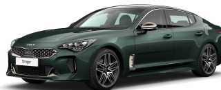
Zelená Ascot (ACG)