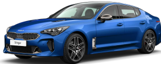
Modrá Micro (M6B)