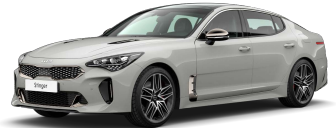
Stříbrná Ceramic (C4S)