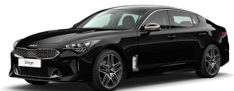
Perleťová Černá Aurora (ABP)