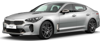
Stříbrná Silky (4SS)