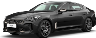
Šedá Panthera (P2M)