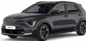
Šedá Interstellar (AGT)