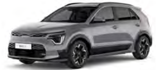
Šedá Steel (KLG)