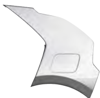
Šedá Steel (KLG)