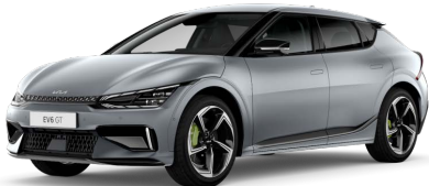
Speciální matná Šedá Mooncape (KLM)