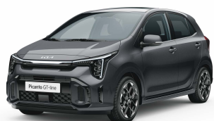
Šedá Astro (M7G)