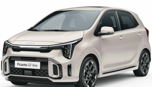
Běžová Milky (M9Y)