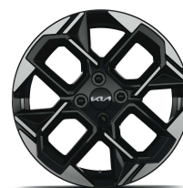
16" kolo z lehké slitiny - GT-Line