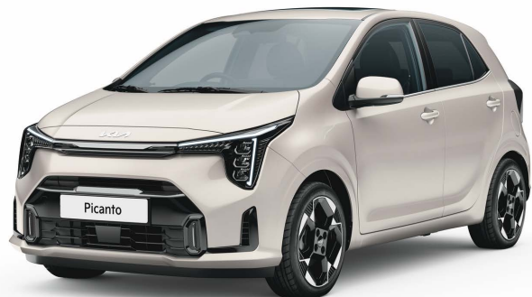
Ilustrační foto. Reálné provedení se může lišit.