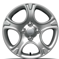
14" kryt ocelového disku - Active - Comfort