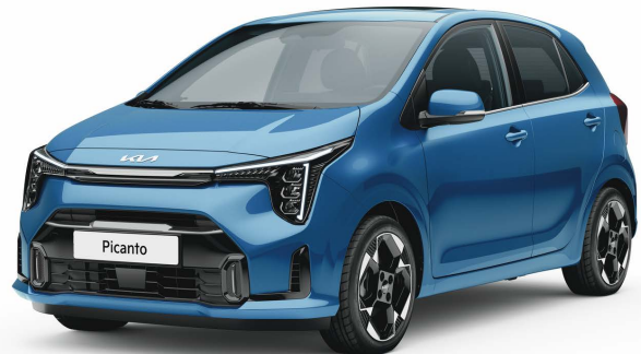
Ilustrační foto. Reálné provedení se může lišit.