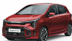
Červená Signal (BEG)