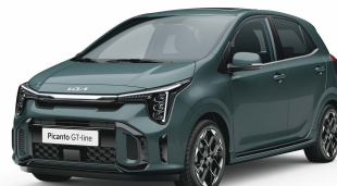
Zelená Adventurous (A2G)