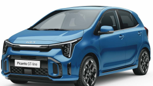
Modrá Sporty (SPB)