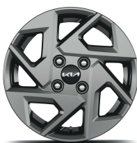
14" kolo z lehké slitiny - příplatkové pro Comfort