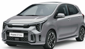
Stříbrná Sparkling (KCS)