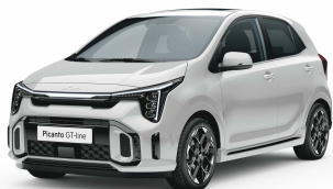
Bílá Clear (UD)