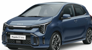
Modrá Smoke (EU3)