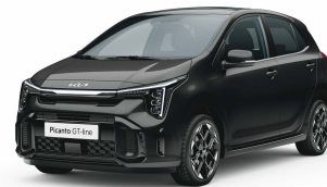
Perleťová černá Aurora (ABP)