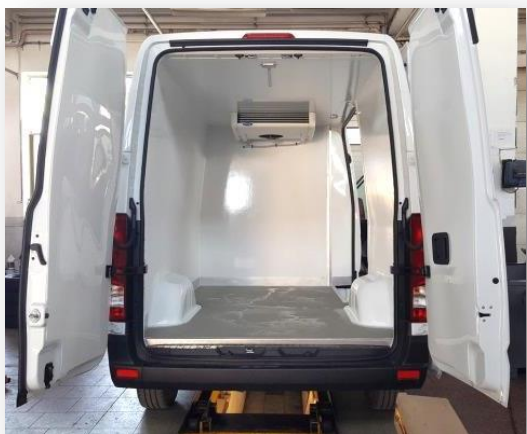
Protiskluzová podlaha s hliníkovými ochrannými lištami