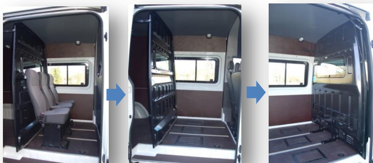
Přepážku lze zafixovat ve dvou pozicích