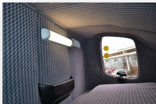
Spací nástavba včetně vyvedení vytápění Webasto