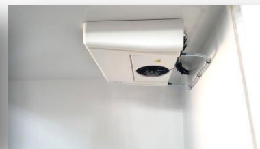
Detail chladícího agregátu zvenku a zevnitř