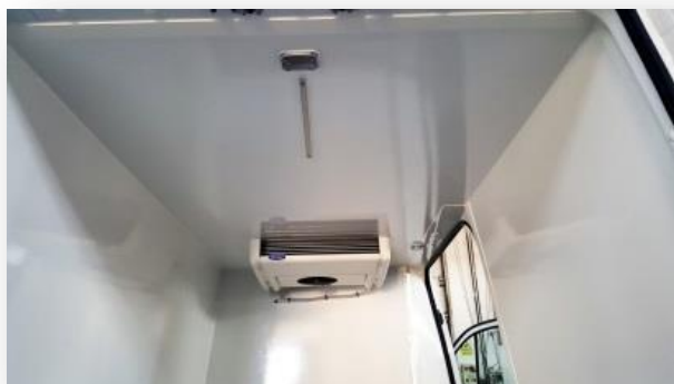
Detail stropu s integrovaným světlem a chladícím agregátem