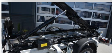
Detail rámové konstrukce a zdvihacího pístu