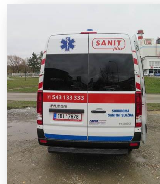
Prosklené zadní dveře