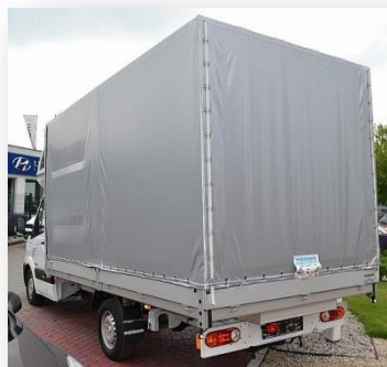
Vůz má zadní schůdek a blatníky