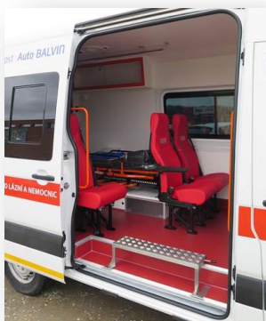
Uspořádání interiéru: 3 sedadla, lůžko a speciální křeslo