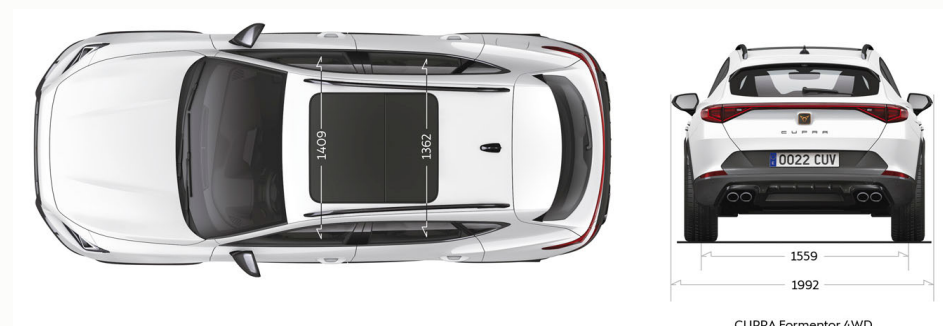
CUPRA Formentor 4WD